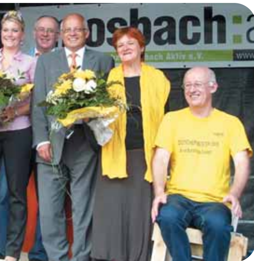
Gruppenbild nach Einlösen des Wetteinsatzes des Kreises Bad Dürkheim: Der Landrat des Neckar-Odenwald-Kreises Brötzel wurde beim Frühlingsfest 2009 in Mosbach in Wein und Zucker aufgewogen.